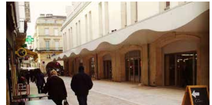
ACTUEL MARCHÉ COUVERT, n°1, 2, 3 ou 4, date : 1973.....

A. Après avoir lu le texte, mettez les édifices dans l'ordre chronologique, du plus ancien au plus récent en entourant 1, 2, 3 ou 4 et en datant leurs constructions.