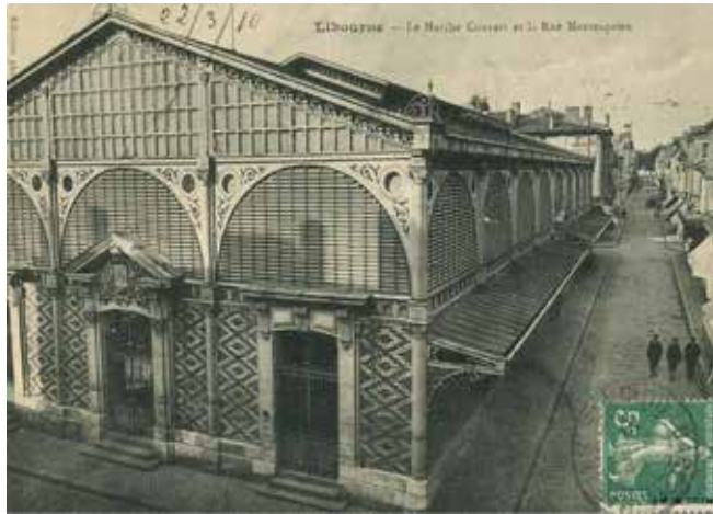
ANCIEN MARCHÉ COUVERT, n°1, 2, 3 ou 4, date 1900.....