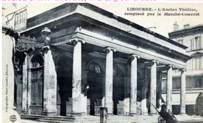
THÉÂTRE n°1, 2, 3 ou 4, date : ..... péristyle de 6 colonnes : .....