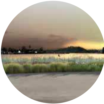
3. JARDIN DE LA CONFLUENCE