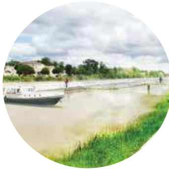
4. PORT DE PLAISANCE