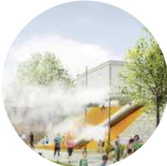
9. PARC DE JEUX