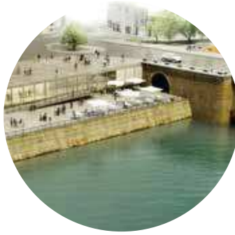
8. ACCUEIL DES BATEAUX