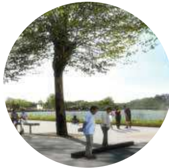
5. TERRAIN DE PÉTANQUE -